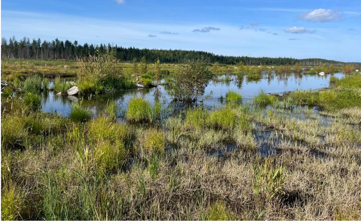
Kosteikot soveltuvat hyvin aurinkovoimaloiden vesienhallintaan ja -suojeluun.