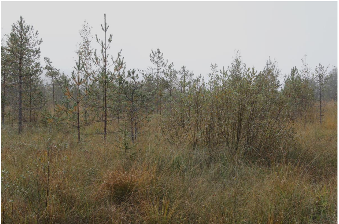
Pintavalutuskenttä vesiensuojelun ratkaisuna on muokkaamaton suo, jolle johdetaan puhdistettavia vesiä.