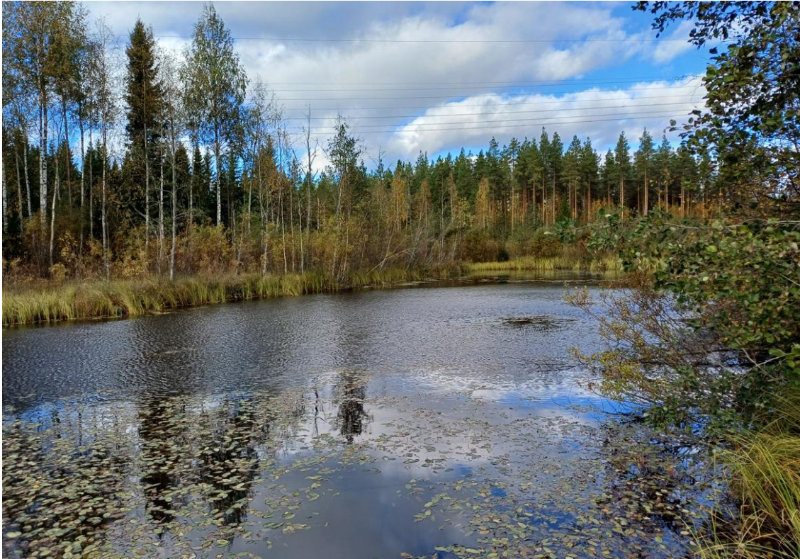
Viitasammakkoa tavataan melko yleisesti käytöstä poistuneilla turvetuotantoalueilla erilaisissa kosteissa elinympäristöissä, kuten sammutusvesialtaissa.

Aurinkovoimarakentamisessa tulee huomioida myös rauhoitettuja eliölajeja koskevat säädökset. Rauhoitettujen eläinlajien yksilöiden tahallinen häiritseminen, erityisesti eläinten lisääntymisaikana tai muuton aikaisilla levähdysalueilla on kiellettyä (Luonnonsuojelulaki 70 §). Maakotkan, merikotkan, kiljukotkan, pikkukiljukotkan tai sääksen pesäpuu on rauhoitettu, jos pesä on toistuvasti käytössä ja selvästi nähtävissä (Luonnonsuojelulaki 73 §).