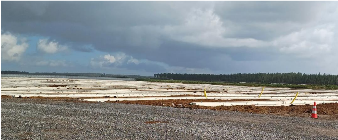
Aurinkovoimalan alue salaojitettiin. Rakentamisen aikana alueelta pumpattiin vesiä pois mutta työn valmistuttua vedenpinta nostetaan säätöpatojen avulla lähemmäksi maanpintaa.