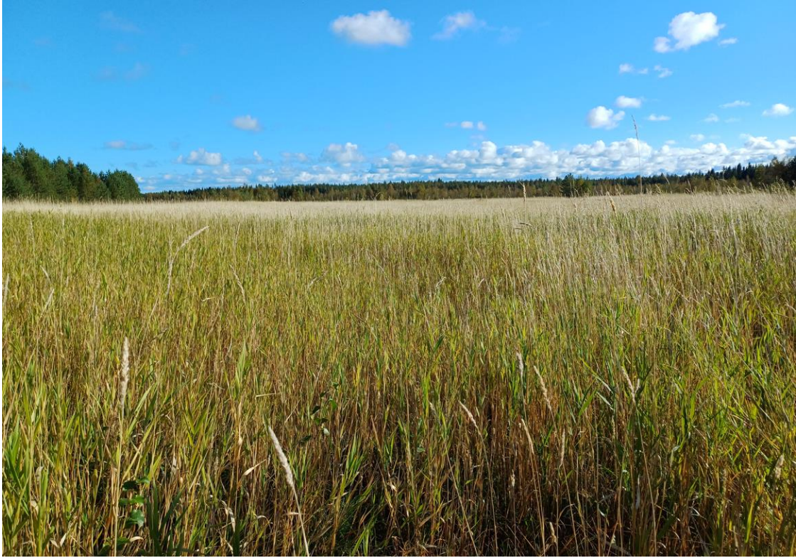
Kasvillisuuskenttä on puhdistusmenetelmä, jossa vesi johdetaan ympäristöstään pengerryksin eristetyn kasvillisuuden peittämän kentän läpi. Kasvillisuuskenttä perustetaan tyypillisesti suonpohjalle ja kasvilajina voi olla ruokohelpi. Kuva: Airi Matila.