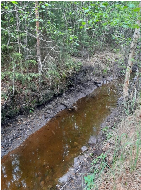
Vedet poistuvat turvetuotantoalueelta laskuojia pitkin vastaanottavaan vesistöön. Tavallisesti laskuoja alkaa turvetuotannon aikaisesta vesiensuojelurakenteesta. Samoja laskuojia voidaan käyttää aurinkovoimalan vesien ohjaamiseen.

Pohjamaan ominaisuudet jäännösturpeen alla vaihtelevat paljon. Useimmiten pohjamaa on heikosti vettä läpäisevää hienolajitteista maata. Vettä pidättävän hienojakoisen kerroksen päällä voi olla karkeampia maa-aineksia, kuten hiekkaa. Myös moreenimaita esiintyy. Erityisesti Pohjanlahden rannikolla esiintyy happamia sulfaattimaita, joiden rikkipitoisten kerrostumien hapettuminen happamoittaa maaperää ja vesistöjä. (ELY-keskus 2024b.) Pohjamaa vaikuttaa merkittävästi eroosioriskiin niissä tilanteissa, joissa ojat ulottuvat turvekerroksen alapuoliseen maahan saakka.