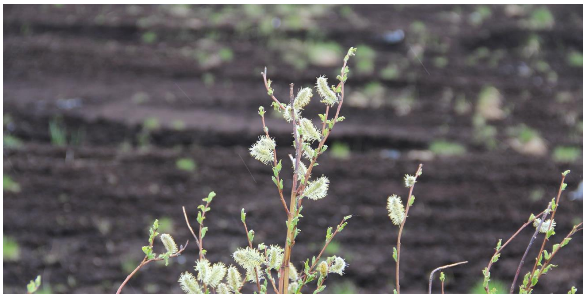
Pajut viihtyvät turvetuotantoalueiden ojissa ja huoltoteiden reunoilla. Kevään ensimmäisinä kukkijoina ne tarjoavat ravintoa monille pölyttävälle hyönteisille.

Mahdolliset viitasammakon ja muiden huomioitavien lajien esiintymät suositellaan selvitetävän ennen suunnittelutarveratkaisu- tai rakennuslupahakemusta. Näin ELY-keskus voi lausua luonnonsuojeluasioista hakemusmenettelyjen yhteydessä. Lainsäädännöstä on tietoa luvussa 2.