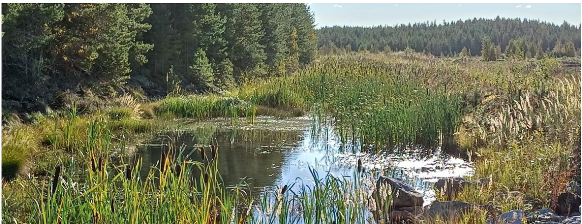
Laskeutusaltailla pystytään poistamaan vedestä ainoastaan karkeinta kiintoainesta. Hienompi aines saadaan poistettua kasvillisuus- tai pintavalutuskentällä ennen vesien päästämistä vastaanottavaan vesistöön.

Vedenpintaa nostamalla vähennetään hapellisissa oloissa tapahtuvaa turpeen hajoamista ja siihen sitoutuneiden ravinteiden vapautumista. Vedenpinnan nosto voidaan toteuttaa kokoojajoihin asennettavilla virtaamansäätöpadoilla.