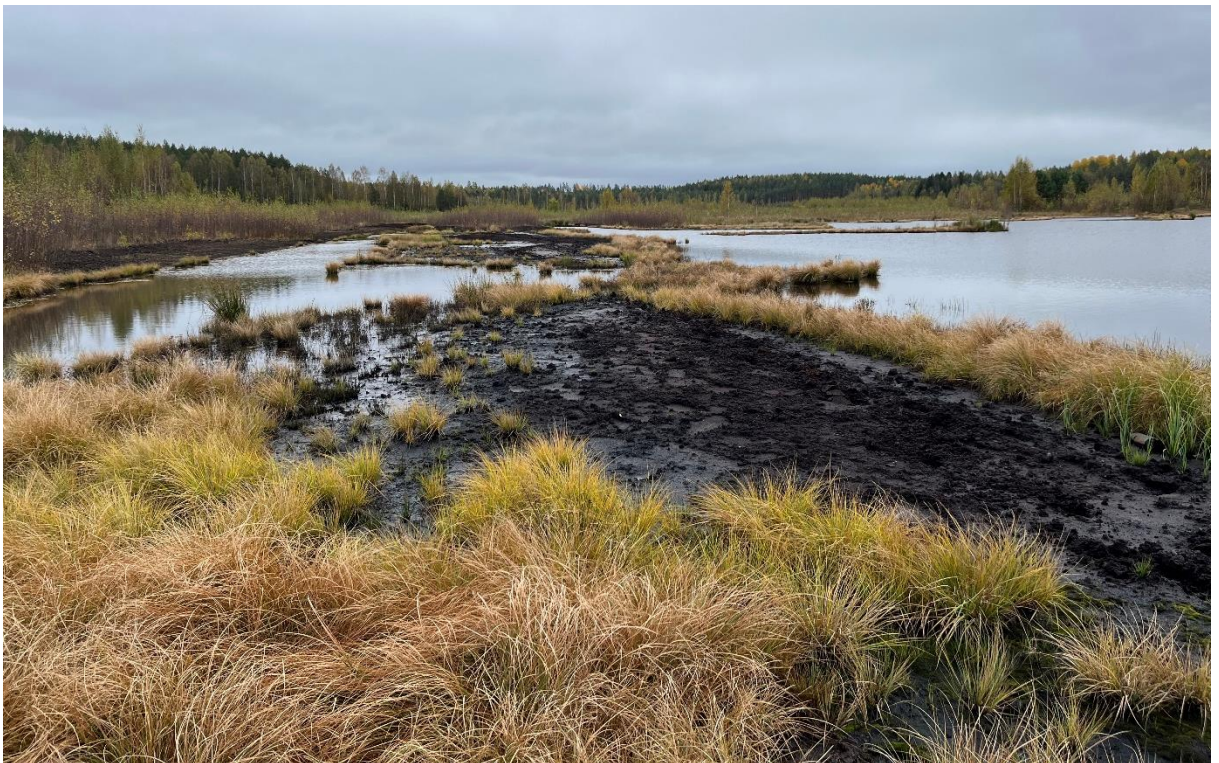
Osan vuodesta veden alla olevat lieterannat tarjoavat vesilinnuille runsaasti ravintoa.

Kosteikkojen suunnittelussa olisi hyvä miettiä pitkän aikavälin hoitotavoitteita, sillä kosteikot kasvavat umpeen ajan kuluessa (Metsänhoidon suositukset i.a.). Hoidon suunnittelu on tärkeää, jos kosteikko on osa alueen vesiensuojelua. Jos kosteikko halutaan pitää avoimena ja säilyttää avovesipinnat, tulee sitä raivata ja mahdollisesti myös ruopata säännöllisesti. Toisaalta umpeenkasvun seurauksena syntynyt alue tarjoaa toisenlaisia elinmahdollisuuksia esimerkiksi suolajeille. Jo olemassa olevien kosteikkojen olosuhteita voidaan myös parantaa esimerkiksi luomalla lisää lietteisiä rantoja pengertämällä, jolloin vesilinnuille syntyy sopivia ruokailualueita.