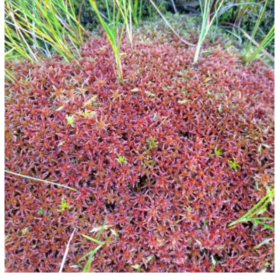
Kosteille paikoille leviää ajan kuluessa erilaisia rahkasammalia, joita Suomessa on noin kolmekymmentä lajia.