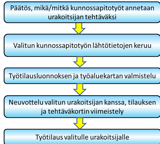
Kuva 2. Työtilausmenettelyn tehtäväketju

Työtilauksen valmistelu etenee alla olevan kaavion ja sitä koskevien ohjeiden mukaisesti.