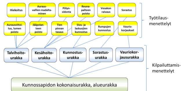
Kuva 1: Metsä- ja muiden yksityisteiden kunnossapidon erikokoisia työkokonaisuuksia

Kuvassa 1 on kuvattu, millaisia kunnossapitokokonaisuuksia voidaan antaa urakoitsijan tehtäväksi joko työtilausmenettelyllä tai kilpailutettuna urakkana .