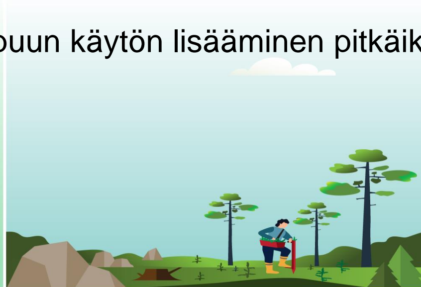
METSÄMAA JA PUUSTO