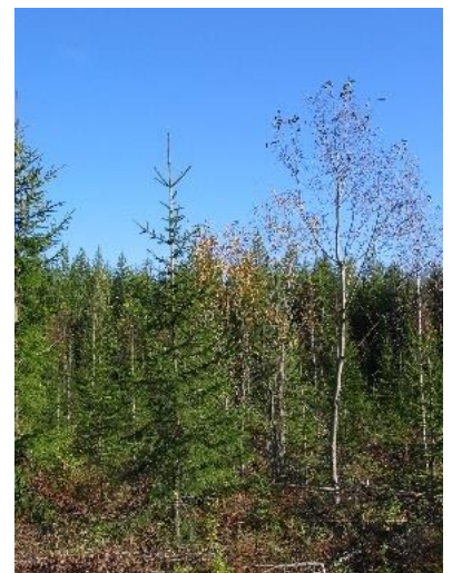
Leppade säästmine istikute vahel.