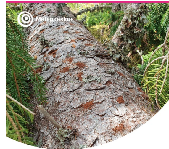
Kirjanpainaja kuusikossa: ennakointi, hallinta ja torjunta