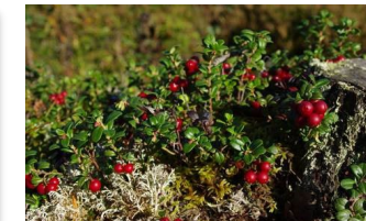
Neuvoja metsänhoitoon perehtyvälle metsänomistajalle

Lorem ipsum dolor sit amet, consectetur adipiscing elit, sed do eiusmod tempor incididunt ut labore et dolore magna aliqua.