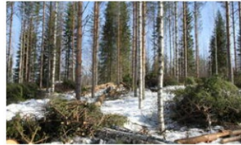
Sekametsän kasvat →

8/24 Uudistettu suositus sekametsän perustamiseen ja kasvatukseen. Sekametsässä pääpuulajia on enintään 75 %. Lisätietoa: päivityksen pääkohdat .